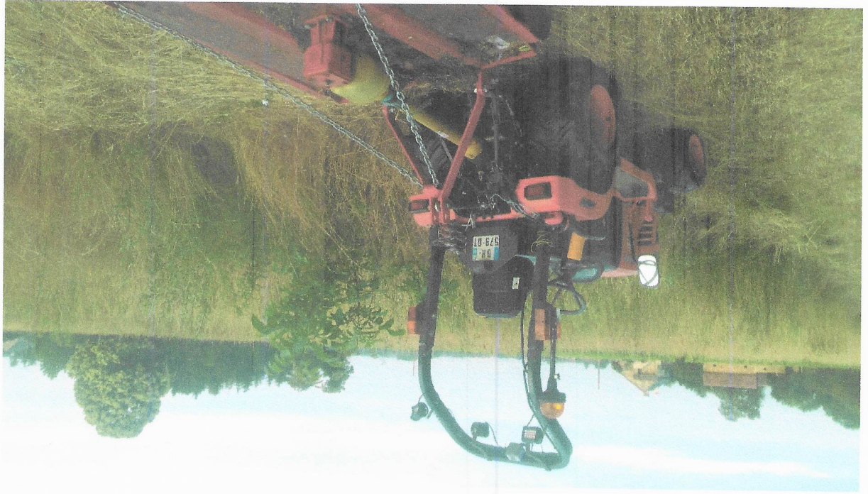
25 juin 2019 (AE 173)