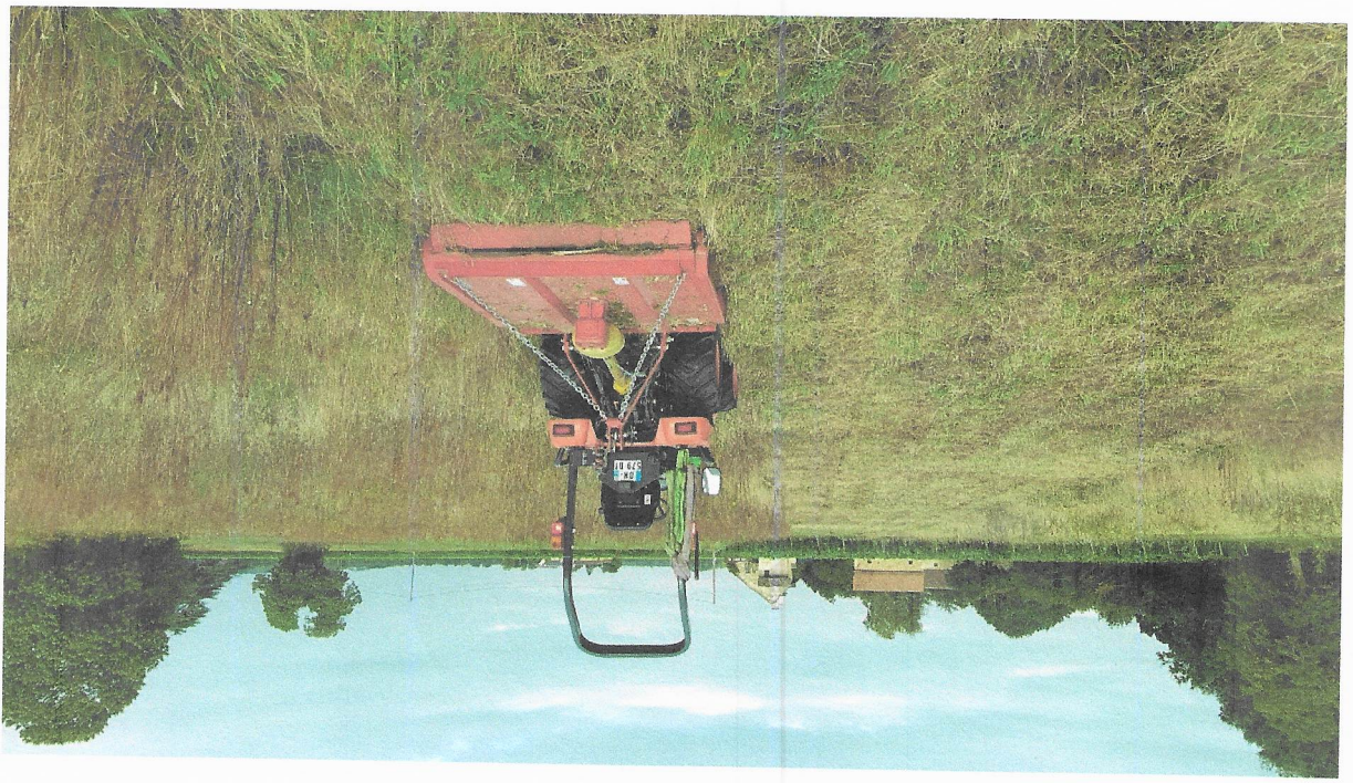
16/08/2017 (AE 173)